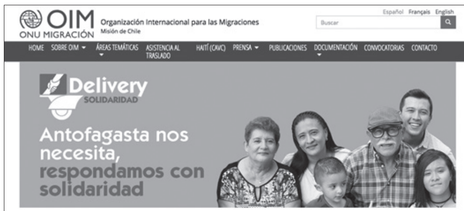
Imagen 3: Difusión campaña Delivery Solidaridad, en Página web, Organización Internacional de Migraciones de Antofagasta.