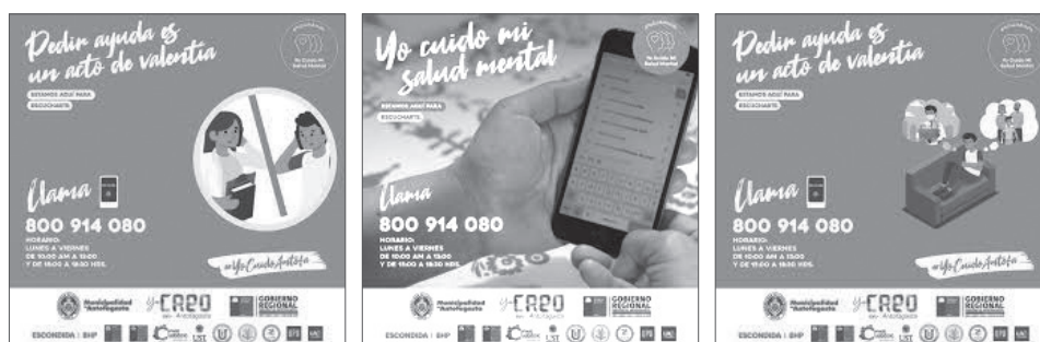
Imagen 1: Campaña de difusión medio digital “WhatsApp” programa “Yo cuido mi salud mental”

En estos ejemplos de acción con una fuerte componente de compromiso social y comunitario, en el caso de los proyectos “Yo Cuido mi salud mental” y “Yo compro en el Barrio”, son iniciativas articuladas desde la Mesa Público–Privada CREO Antofagasta. En el caso del programa de salud mental, participan todas las universidades locales que imparten la carrera de psicología, con el propósito de diseñar e implementar una plataforma Fono Ayuda, para primeros auxilios psicológicos. En esta Mesa de salud psicológica, la UCN es representada por la Escuela de Psicología y el Centro de Atención Psicosocial, (CIAP), entregando un apoyo específico con orientación de terapia familiar y problemáticas psicológicas derivadas de los procesos migratorios.