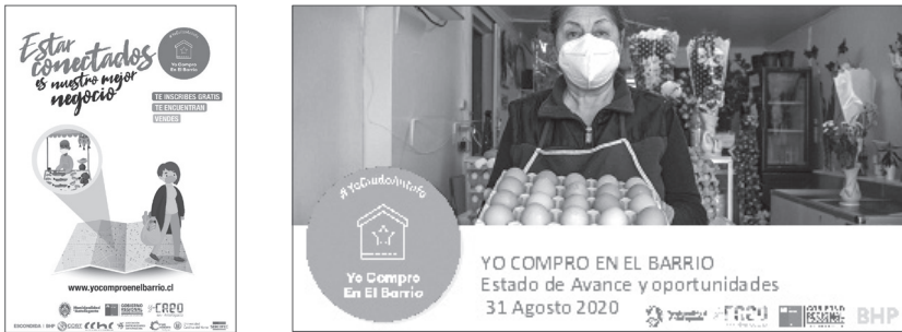
Imagen 2: Campaña difusión medio digital “WhatsApp” programa “Yo Compró en el barrio”

El programa “Yo Compró en el Barrio – Estamos Funcionando” es una iniciativa articulada por CREO Antofagasta – Fundación Chile con la Ilustre Municipalidad de Antofagasta, Gobierno Regional de Antofagasta, Cámara de Comercio de Antofagasta, Asociación de Emprendedores de Antofagasta, Sercotec, Cámara Chilena de la Construcción y la Universidad Católica del Norte. “Yo Compró en el Barrio es una plataforma que busca visibilizar los negocios y emprendimientos a través de mapas virtuales y físicos que puedan fomentar el comercio de barrios, apalancando el comercio y evitando los desplazamientos innecesarios.” (CREOANTOFAGASTA, 2020) 5