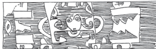
Figura 7. Personaje con felinos.