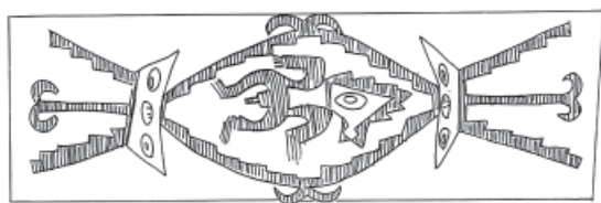
Figura 2. Personaje con máscara felínica.

El tipo denominado “Personaje con máscara felínica” está presente en nuestra muestra a través de dos piezas (Figuras 2 y 3).