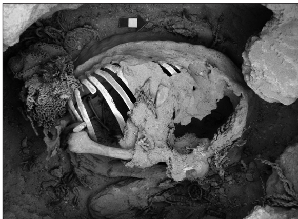
Figura 6. Detalle del entierro CH7.5 durante la excavación, donde se observa la fosa en que fue depositado el individuo y los elementos que componían su ajuar.