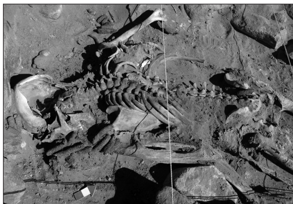
Figura 4. Detalle del entierro CH3.8 durante la excavación, destacando la posición del cuerpo, meteorización del cráneo y ofrendas vegetales.