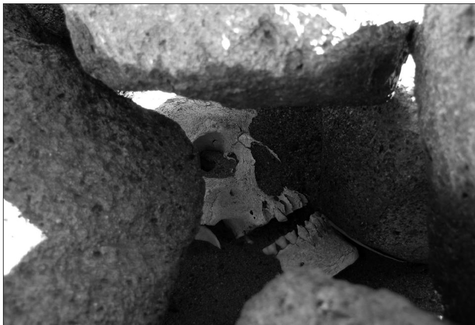
Figura 8. Detalle del cráneo en el entierro CH2.5, visible bajo las piedras que formaban su tumba.

de material cultural propio de tierras altas. Por ejemplo, el individuo CH2.5 es un adulto masculino enterrado bajo un amontonamiento de piedras (Figura 8). Su deformación craneana tabular erecta lo asocia con las poblaciones agrícolas del interior. Él no fue sepultado con muchos bienes, acompañado solo por textiles y una concentración de restos de camélido y alimentos. Su tumba fue ubicada en un espacio de carácter habitacional, mostrando la reutilización del mismo espacio habitacional de viajeros y reafirmando esta idea de viajes recurrentes de individuos.