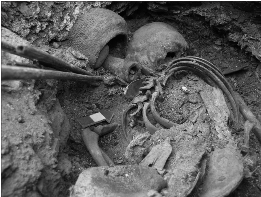
Figura 3. Detalle del contexto mortuario CH3N.7 durante la excavación; junto al esqueleto del niño se observan algunas de las ofrendas que lo acompañaban, incluyendo restos de pescado.