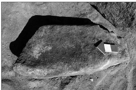
Figura 5. Piedra con restos de pigmento rojo que formaban parte de la tumba CH3.8.