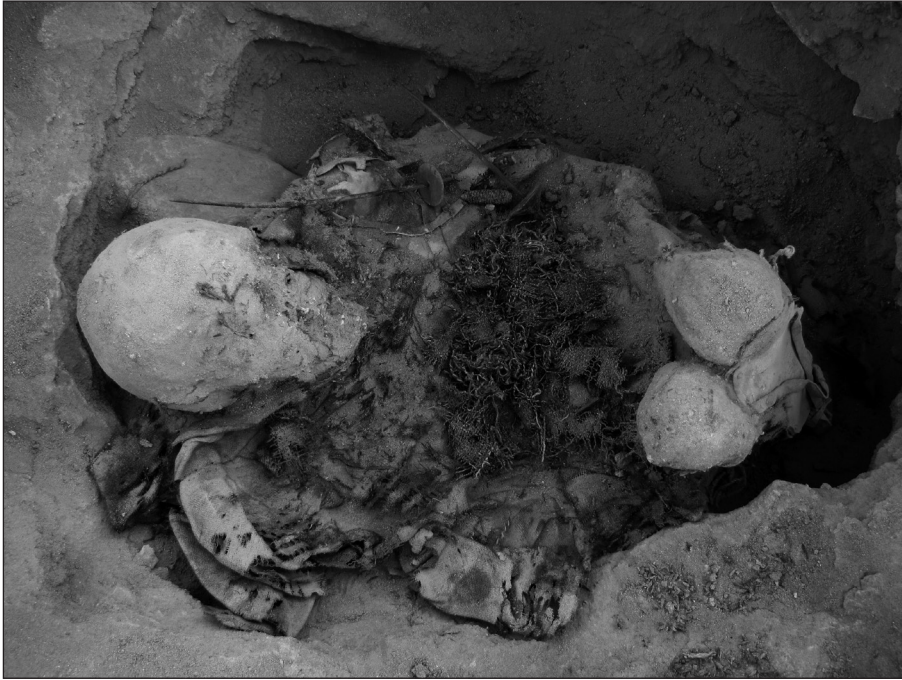
Figura 2. Detalle del entierro CH1.2 durante la excavación, donde se observa la fosa en que fue depositado el individuo y algunos de los elementos que componían su ajuar.