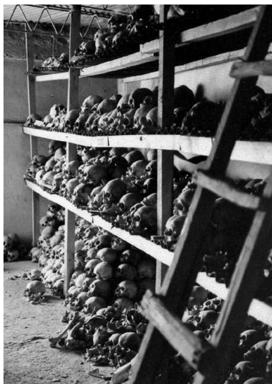
Figura 3. Colección de cráneos obtenida en las excavaciones de Le Paige (décadas del 60 y 70).

es particularmente interesante si se considera que el temor a los “abuelos” puede ser producto de la acción cristiana, ya que, de ser así, Le Paige negó una creencia impuesta por su religión en su propio afán de extirpar idolatrías.