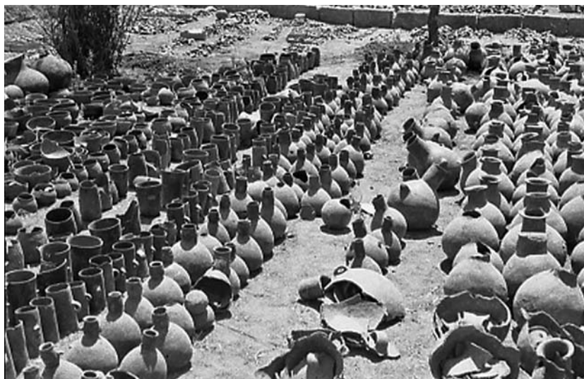
Figura 2. Colección de cerámica obtenida en las excavaciones de Le Paige (décadas del 60 y 70).

siderarse importante erradicar estas creencias. Al respecto, uno de sus ayudantes atacameños plantea que este sacerdote con sus excavaciones “quería dar a conocer que los gentiles no hacían nada”, lo cual